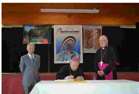
altre foto sul sito dell'Associazione